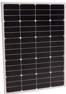
Sun Peak SPR 80

Standard4 connectors / Standard4 Verbinder