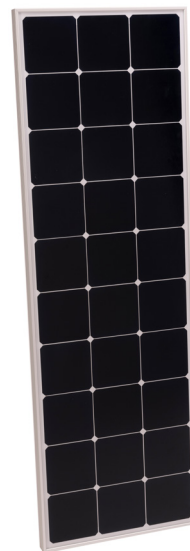
Sun Peak SPR 110_Small silver