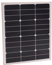
Sun Peak SPR 40