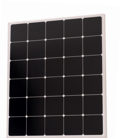
Sun Peak SPR 110_Compact